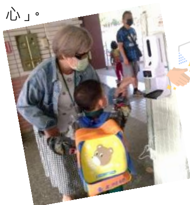
感謝志工家長幫忙消毒教室

「幸福源自~家庭經營」東光附幼拋磚引玉，鼓勵家長把握與孩子相處的甜蜜時光。「寶貝成長--親師合作更能事半功倍」。在學期末我們會與家長來個小約會~「親師約談」。談談孩子在校學習的總體表現、態度，其優異或需加強...。也聽聽家長對園方辦學績效的看法、建議，讓我們可以更好。防疫期間，志工家長協助孩子「晨間入園導護」、教室「清潔消毒」。小小孩才能安心的和爸媽揮揮手、說再見，而教室的防疫守護牆，才能鞏固不摧。我們衷心感念您和我們一起實踐——「家園同心」。