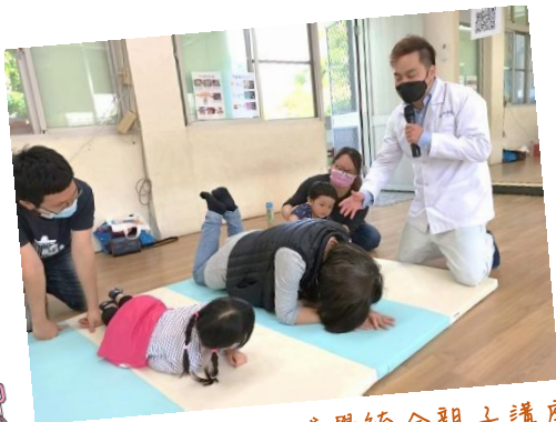
動滋動滋~感覺統合親子講座