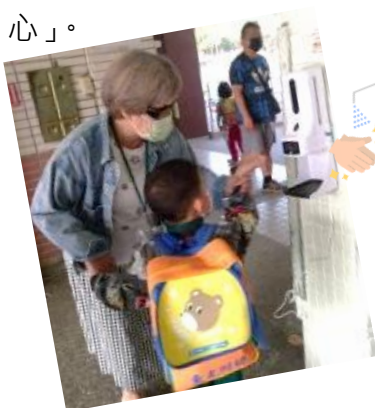
感謝志工家長幫忙消毒教室