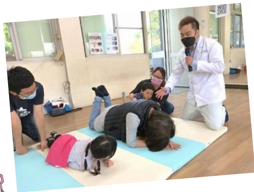
動滋動滋~感覺統合親子講座